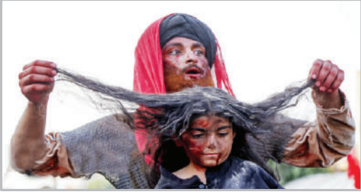
دسته نمادین کاروان اسرای کربلا