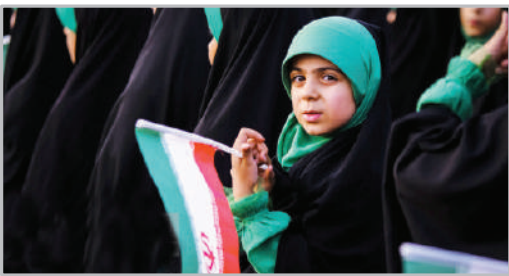
اجتماع دختران انقلاب در ورزشگاه آزادی