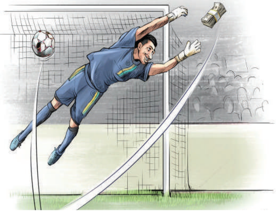
مدیرعامل پرسپولیس: فوتبال ما به اندازه سقف قراردادها رشد نکرده