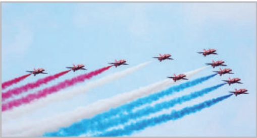
نمایشگاه هوایی - انگلیس