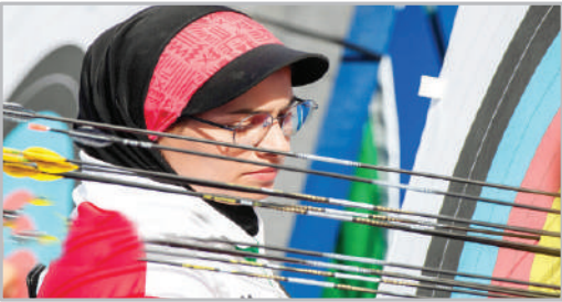
مسابقات مقدماتی تعیین جایگاه تیروکاران - المپیک ۲۰۲۴ پاریس