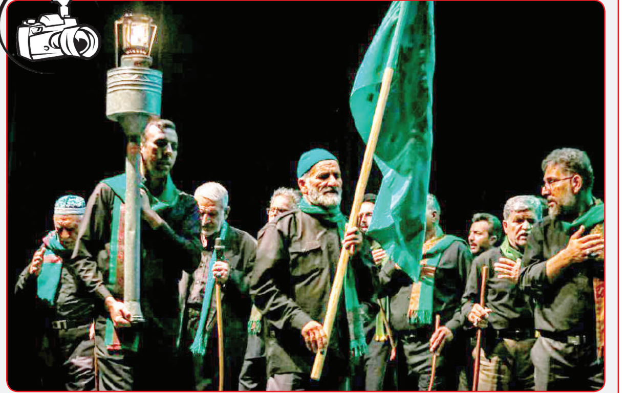
سوکواره بین‌المللی آیین‌ها، آواها و نواهای عاشرایی - شیراز، تالار حافظ